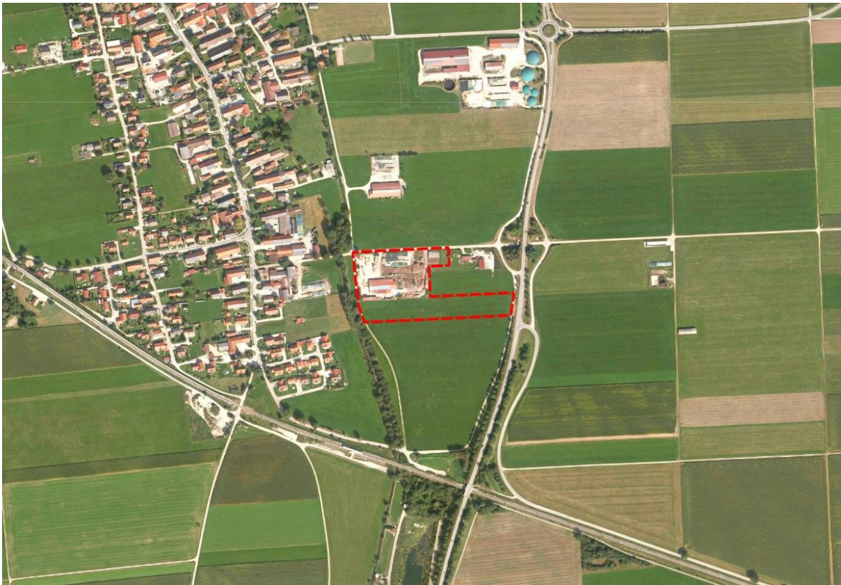
Abbildung 1: Räumliche Lage des Plangebietes 16. Änderung des Flächennutzungsplans mit integriertem Landschaftsplan im Bereich „Sondergebiet Holzverarbeitung Frauenweg Süd“ – Übersichtskarte

Ziel der Planung ist es, dem bereits ortsansässigen Handwerksbetrieb durch die Schaffung von Baurecht Möglichkeiten für maßvolle Erweiterungen im Rahmen einer Betriebsleiterwohnung anbieten und auch den Bedarf an Lagerflächen decken zu können.