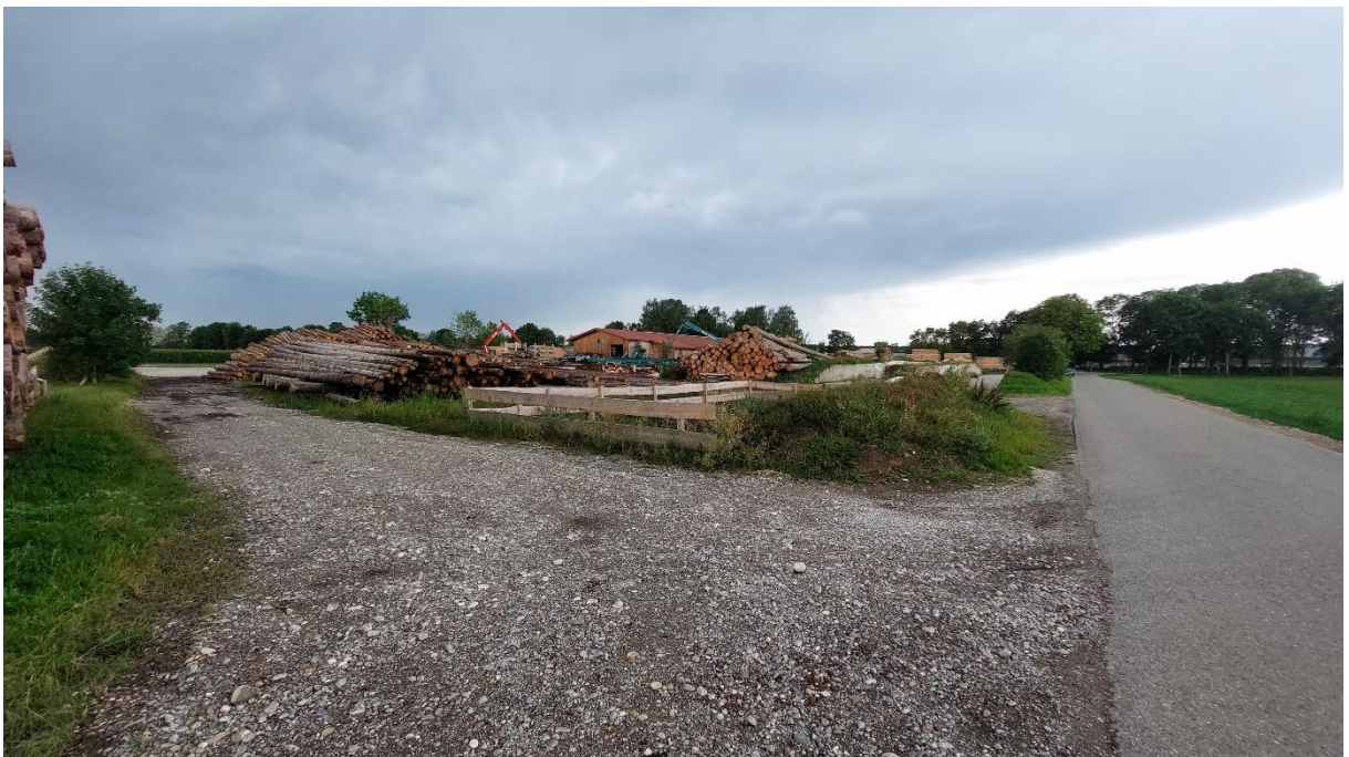
Abbildung 5: Blick von West nach Südost entlang des Frauenweges, Aufnahme von August 2023