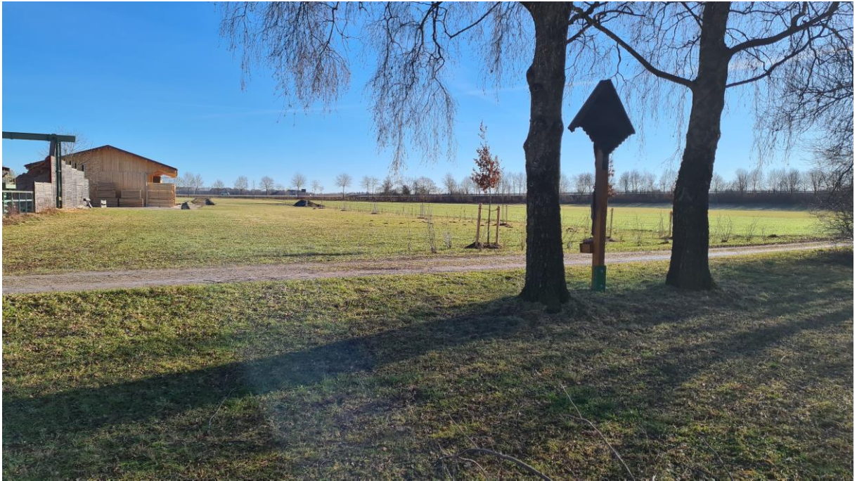
Abbildung 4: Blick auf das Plangebiet vom Wörthbach aus (Blickrichtung West nach Ost), zu sehen ist ein Wegkreuz rechts im Bild, dahinter die bereits angelegte Ausgleichsfläche aus dem Bauantrag von 2022 und die bestehende Bebauung im Westen. Die Gehölze im Hintergrund begleiten die MN 23. Aufnahme von Januar 2024.