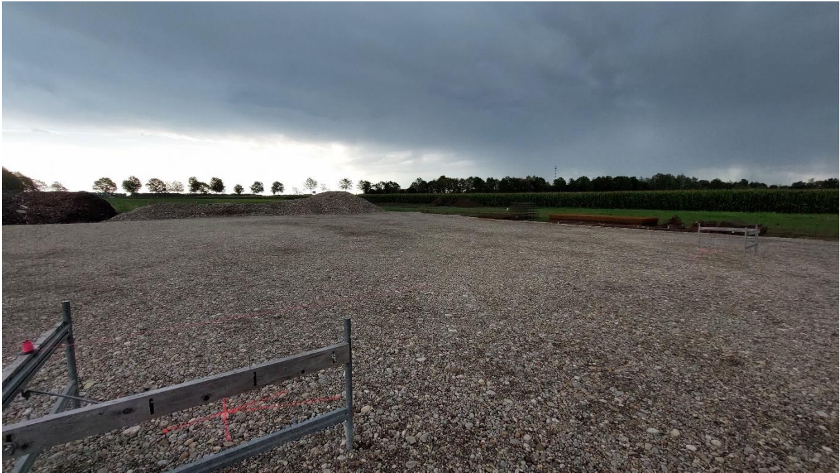
Abbildung 6: Blick nach Osten, Aufnahme von August 2023, zwischenzeitlich wurde die Lagerhalle errichtet